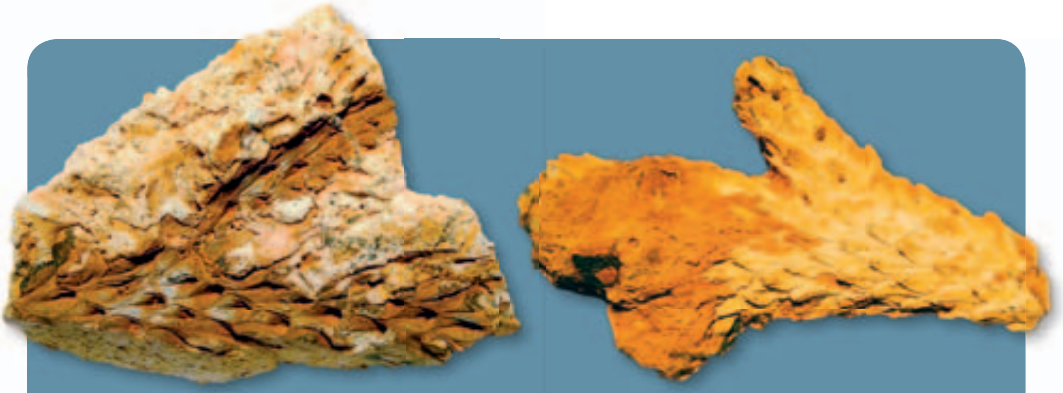
Abb. 3, oben links: Negativabdruck in Sandstein, unterer Teil 7 cm lang.